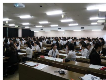
ビジネスマナー・企業研究講座