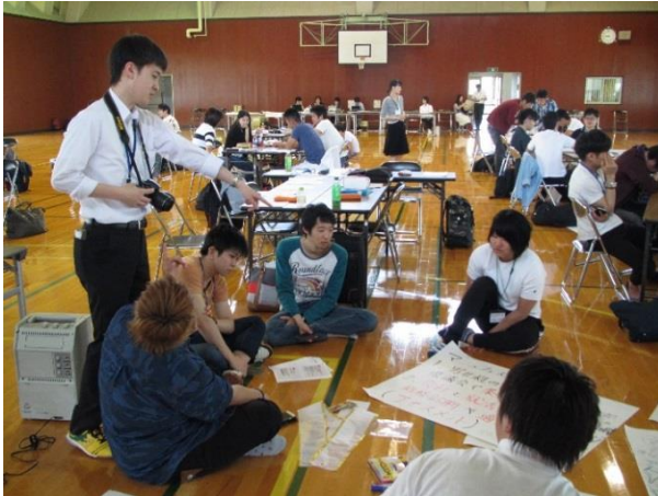
○プレゼン資料作成風景