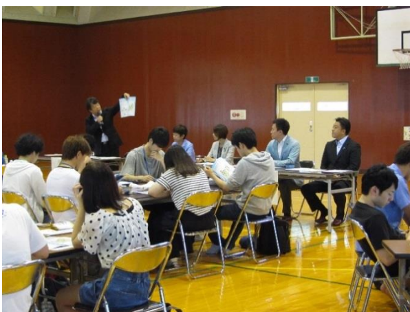
○県議会議員との意見交換会