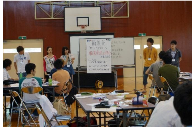
○プレゼンテーション