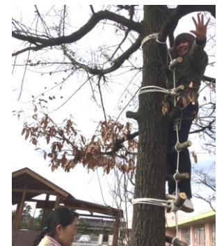
図 5. 縄梯子

小杉西部保育園の園庭でも「高さ」や「揺れ」といった、ちょっと怖い、ドキドキするような経験ができるとういと考え、園庭で一番大きなどんぐりの木に、縄梯子を吊るすことにした(図5)。ロープワークに詳しい兼崎亜紀子さん(富山森のこども園 ツリーイングインストラクター)にご指導いただき、森で集めた小枝をのこぎりでちょうどいい長さに切りそろえ、それをロープで結びにしてくくりつけていく。結び自体はシンプルで簡単そうに見えるが、ねらった高さで枝が留まってくれず、なかなか等間隔のはしごにならない。何度もやり直してようやく完成した。途中はしごに体重をかけて、安全性を