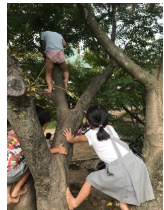
図 4. 木登り

石動青葉保育園の子どもたちは木登りが大好きである(図4)。大きなサルスベリの木には、園長先生が「この木のとっぺんまで、子どもたち登らせてやりたいなあ」と願って、依頼を受けた野原さんが一年がかりで探し出したという抜群に枝ぶりのいいスギの木が添えられているので、その枝に足をかけて子どもたちはサルスベリの木のとっぺんまでどんどん登っていく。初めて見たときはとても心配したが、園長先生に「あんな高いところまで登ろうとする子は落ちないもので、落ちるような子はもっと低いところで落ちるし、そんな高いところまで登ろうとしない。」と教えていただき、腑に落ちた。確かにその通りで、「あぶないからさせない」というのは、本当に子どものことを考えた保育とはいえないことに気づかされた。