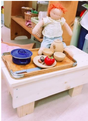
図 6. 木製ベンチ

ちびっ子ハウスは、東屋と呼べるような木製の小屋で、ヘチマのグリーンカーテンを這わしたりプランターを周囲に並べたりしていたが、その程度であり遊びが繰り返されているようではなかった。そこで、ちびっ子ハウス周辺でもっとままごと遊びが楽しくなるように、木製ベンチを手作りすることにした(図6)。これも石動青葉保育園でヒントを得たもので、軽いシンプルなコの字型ベンチは、ベンチにもテーブルにもなり、子どもが自分で持ち運んで好きな場所で遊ぶことができる優れたものである。設計図を書いて、木材選びから行い、材料を買い揃えた。持ち運びしやすいようにできるだけ軽くしたり、座った時に安定するようやすりで削ったり角をまるくしたりさまざまな工夫をした。そうやってなんとか一つベンチを作り上げた。