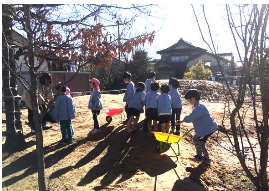
図 7. 築山で遊ぶ

ほかにも、木製キッチンや調理器具、子ども用のほうき、ちりとり、デッキブラシなど、子どもたちの遊びが広がっていくように、また手にとって遊ぶときにも、遊び終えて片付けてそこに置かれているときにも、シンプルな実用性と美しさを備えてあることが大事であると考えて、自然素材を使い、本物の質感が感じられる遊具を選定した。また子どもたちもこれから一緒に園庭改造作業に楽しく参加できるように、一輪車やワゴン車も用意した。子どもたちにはちょうど12月25日に贈呈することになり、まさにクリスマスプレゼントとなり、子どもたちは大変喜んでくれて、さっそく遊び始めた。まだ踏み固められていない築山でドロドロになることも厭わず、友達と一緒にワゴン車を押ししたり引いたりしながら何度もできたばかりの築山ロードを駆け回る子たち(図7)。木のブランコでターザンのように揺れている子。縄ばしごの高いところまでのぼった子はハンモックの子たちに手を振っている。初めて乗るハンモックで最初は「2人ずつだから並ぼう」と言っていた子どもたちが「3人乗れるかな」「4人はどうかな」と実際に体験してみたら「3人までは大丈夫」と自分たちで考えてルールを決めていた姿が印象的だった。ハンモックの中で友だちとの触れ合いを楽しんだり(図8)、待っている友だちがいるから代わろうと友だちのことを考えたり、友だちとの関わりも遊びの中で学んでいた。またちびっ子ハウスでは、キッチンやベンチで、ままごと遊びがにぎやかに繰り返されていた。今まで何もなく、子どもたちの遊びが始まっていかなかった場所だったところで、今たくさんの遊びが生まれている。自分で手作りしたり、選んだりした遊具で子どもたちが楽しそうに遊ぶ姿は、本当に嬉しいもので、大きなやりがいを感じるとともに、「春には築山にどんな種を蒔こうか」と、子どもたちの遊びを見ながら次のつくりかえを考え始めている自分がいた。今後も遊具や築山で遊びが展開し、子どもたちが外遊びを更に楽しいと思える園庭に変わってほしい。