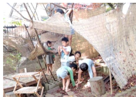
図1. 石動青葉保育園園庭

石動青葉保育園の園庭は、今まで見てきた園庭とは大きく違っていた。ここは小矢部市内に13園ある幼稚園・保育園のなかでも最小の小ぶりの園庭なのだが、手狭な感じはまったくなく、むしろ園庭というよりも里山そのものだった。いくつもの築山が重なり、地面は凸凹していて、ちょうどいい具合に草で覆われている。子どもたちがいつも裸足で駆け回って遊ぶおかげで、雑草が踏まれて、草取りの苦労もないそうだ。園庭のいたるところに木々が茂り、雨や夏の強い日差しを遮ってくれている。初めて見学に行った日も強い雨が降っていて、少し残念に思いながら園に向かったのだが、行ってみると思いがけずたくさん子どもたちが園庭で遊んでいた。園庭の真ん中に小川が流れていて、子どもたちは笹舟を流したり、流れの中に入ってずぶ濡れになっていたり、池のほうで生き物を探していたりと、水という素材が遊びの多様性をさらに高めていることがわかる。ここでは子どもたちは、水・土・砂・木・石・動植物という自然(素材)と触れ合っ、「好きな場所で」「好きな遊びを」「好きなだけ」遊びこむことが保障されている。