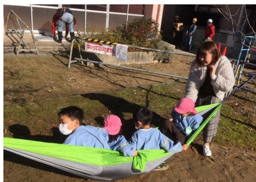
図 8. ハンモック