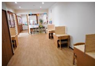
写真 3 個別の学習環境