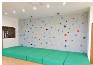
写真 2 体を動かせる環境