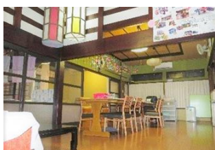
写真 1 家庭的な空間

一方、多くの事業所が既存の住宅などの建物を改修しているため、段差が多く、廊下が狭いなどの問題があり、その都度改修するなどの後付けの設備が印象的だった。これは、児童福祉施設の設備及び運営に関する基準や、放課後等デイサービスガイドラインには細かな規定がないための課題だと思った。