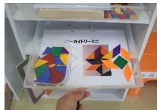
写真 4 学習教材