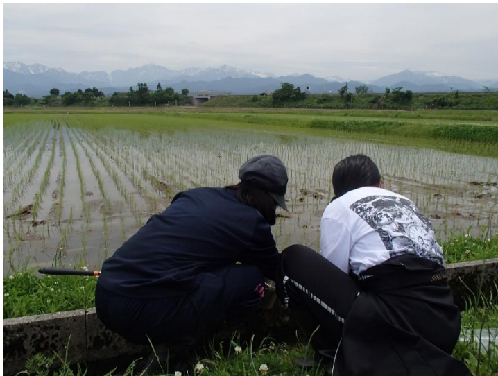
新規生育地の調査風景