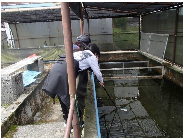
既存生育地の調査風景